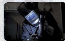
Schweißen Internationales Diplom Schweißen, Schweißprüfbescheinigungen nach DIN EN 287-1 / DIN EN ISO 9606