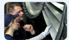
Luftfahrt Fluggastservice Ticketing / Check-In / Lost & Found

Start der Umschulungen am 03.08.2015 - 24 Monate - mit HK-Abschluss Förderung mit Bildungsgutschein und Arbeitsplatzzusage von Franke + Pahl