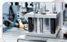
Automatisierung Elektroniker/in Automatisierungstechnik Mechatroniker/in