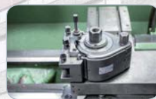
Metalltechnik Industriemechaniker/in Zerspanungsmechaniker/in