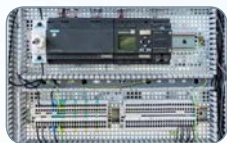
Elektrotechnik Elektroniker/in Betriebstechnik

Förderung mit Bildungsgutschein | Hohe Aufnahme in den Arbeitsmarkt | Einstieg fortlaufend möglich