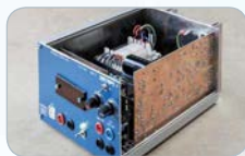
Elektronik Elektroniker/in Geräte und Systeme