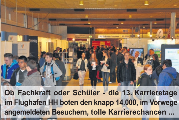
Ob Fachkraft oder Schüler - die 13. Karrieretage im Flughafen HH boten den knapp 14.000, im Vorwege angemeldeten Besuchern, tolle Karrierechancen ...