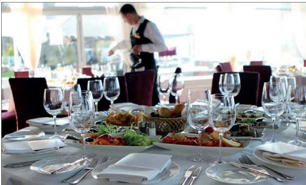
Der Ehrengast bekommt den besten Platz beim Geschäftsessen

Bei einem Geschäftsessen sitzt der Ehrengast rechts vom Gastgeber