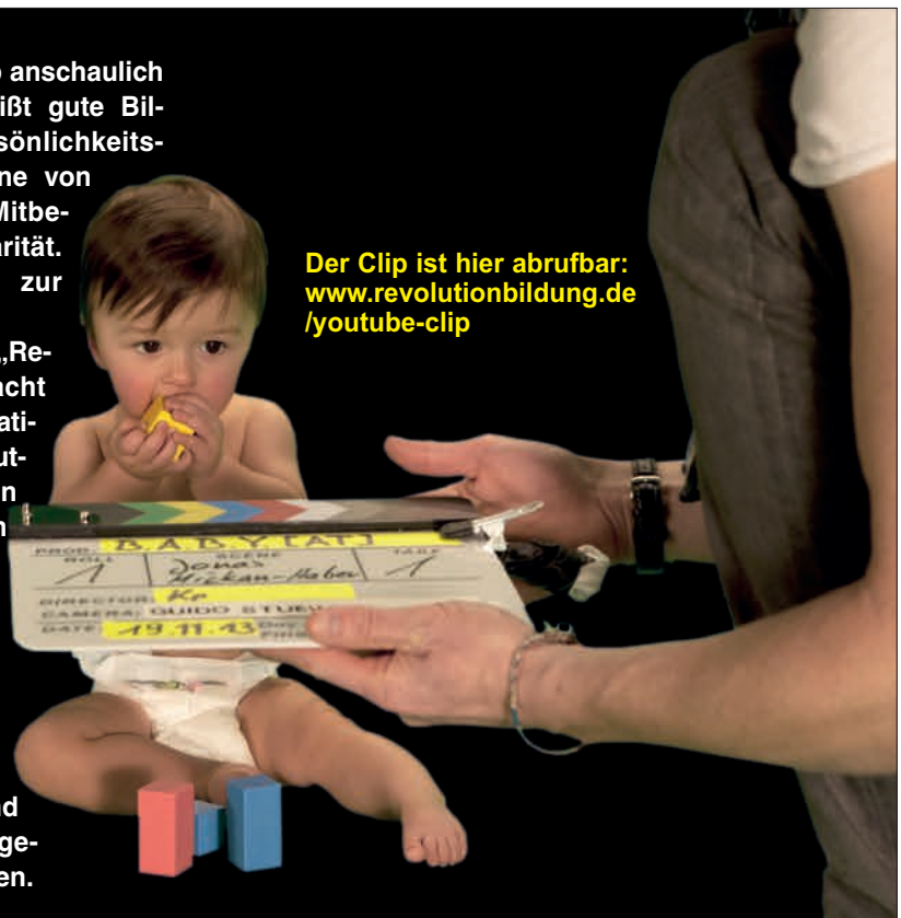
Der Clip ist hier abrufbar: www.revolutionbildung.de/youtube-clip

Mit der Kampagne „Revolution Bildung“ macht die IG Metall auf dramatische Missstände im deutschen Bildungswesen aufmerksam. Fragen nach Qualität, Zugang, Zeit und Geld für Bildung stehen im Mittelpunkt der Aktionen der Gewerkschaftsjugend, die begonnen hat, Schüler, Studierende, Auszubildende und junge Beschäftigte gemeinsam zu organisieren.