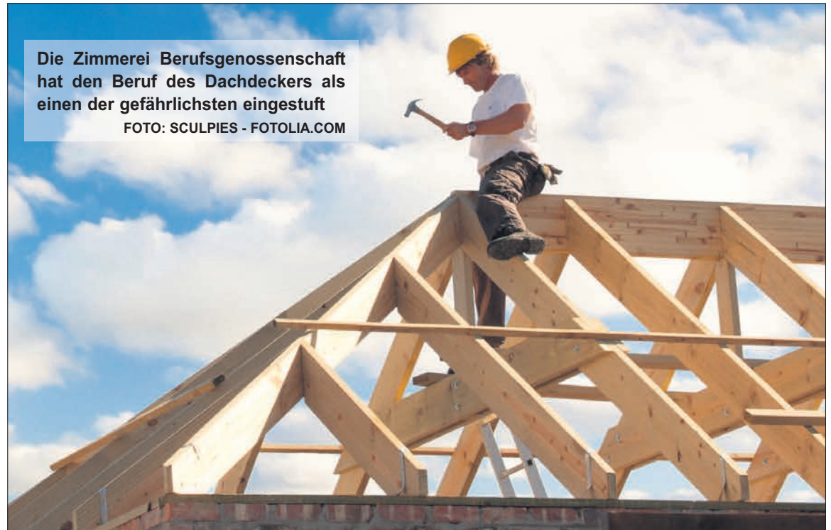
Die Zimmerei Berufsgenossenschaft hat den Beruf des Dachdeckers als einen der gefährlichsten eingestuft