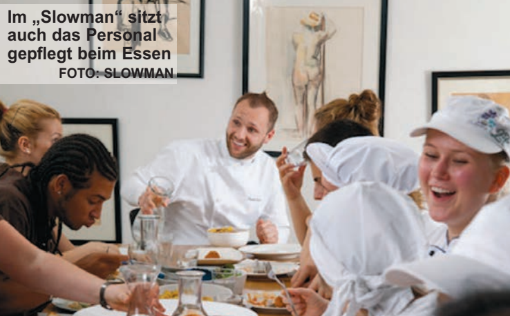
Im „Slowman“ sitzt auch das Personal gepflegt beim Essen

Kontakt: Restaurant „Slowman“, Burchardstraße 13, 20095 Hamburg, 040 – 33 75 61 oder www.slowman.de