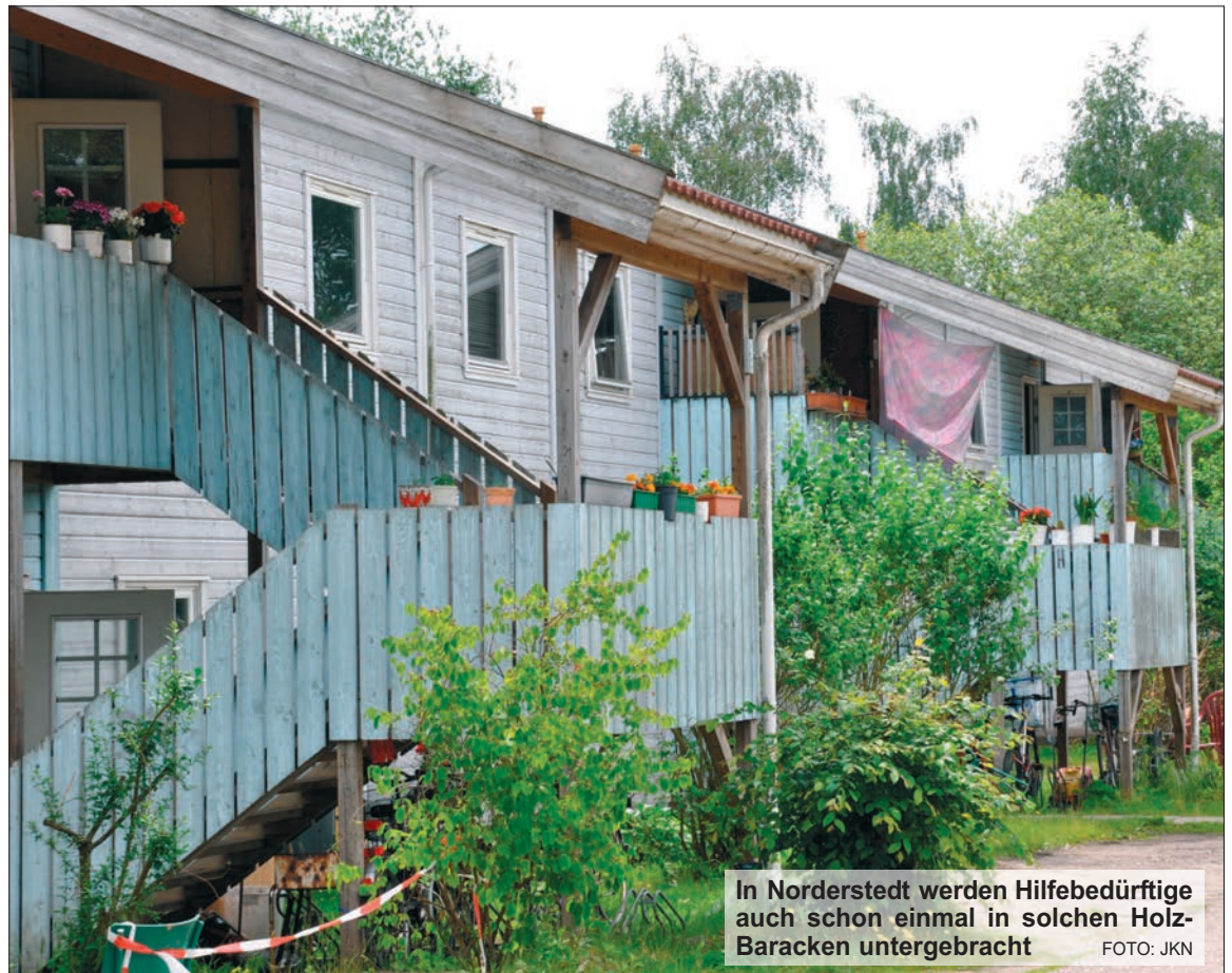
In Norderstedt werden Hilfebedürftige auch schon einmal in solchen Holz-Baracken untergebracht

Im Kreis Segeberg müssen sich mehrere tausend Familien eine neue Wohnung suchen, weil die Verwaltung den Mietkostenzuschuss kürzt. Problem: günstigeren Wohnraum gibt es kaum. CDU und DIE LINKE wollen gemeinsam gegen die ungerechten Kürzungen vorgehen