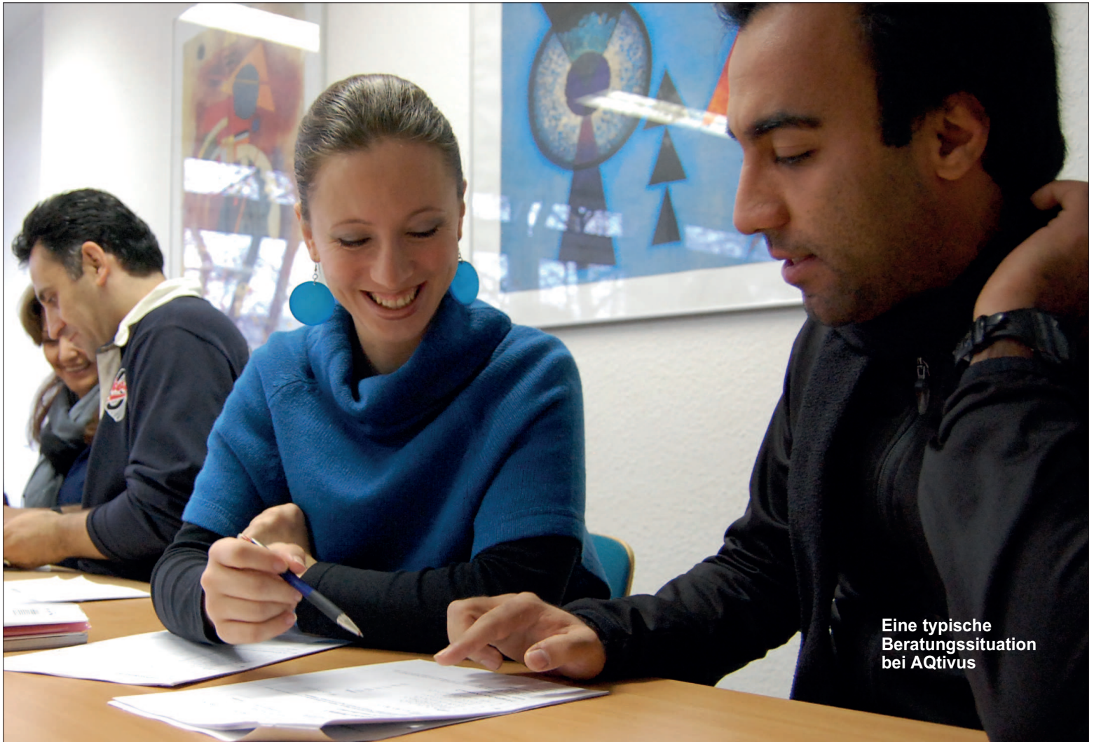
Eine typische Beratungssituation bei AQtivus

AQtivus ist eine Tochtergesellschaft der Arbeiterwohlfahrt (AWO). Sie setzt sich mit speziellen Projekten unter anderem dafür ein, dass die Migranten der Stadt eine faire Chance auf die Integration am Arbeitsmarkt erhalten