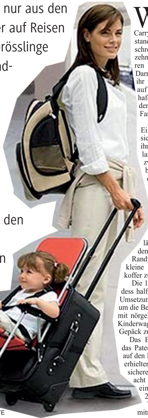
Der Ride-On wird ganz einfach an den Koffer montiert

So eine Idee kann nur aus den USA kommen! Wer auf Reisen geht und seine Sprösslinge nicht durch die endlosen Weiten des Flughafens zerren will, der macht sich einfach das Patent des „Ride-On Carry-On“ zu Nutze: Ein portabler Stuhl wird an den Trolley geschnallt, Kind setzt sich rein und auf geht's