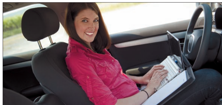
Mobilität, Freude am Umgang mit Menschen, Erfolgswillen und Führungsqualitäten sollte ein angehender Versicherungskaufmann im Außendienst mitbringen

bei Ihrer Tätigkeit. Darüber hinaus bietet die DEVK ein umfassendes Schulungsangebot, dass Sie optimal auf Ihre zukünftige Tätigkeit vorbereitend und bei Ihrer beruflichen Entwicklung begleitet.