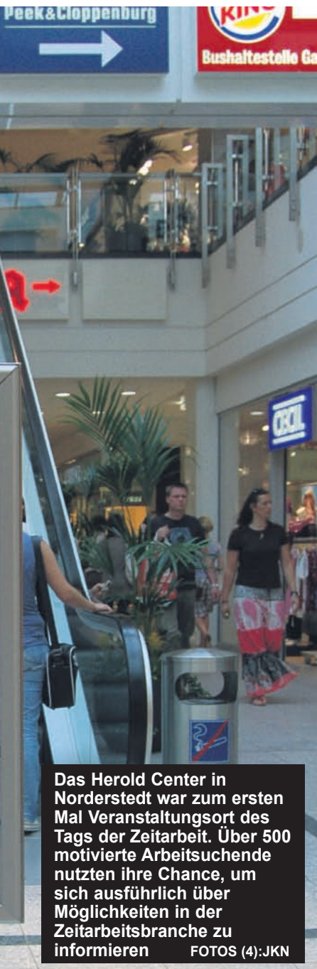
Das Herold Center in Norderstedt war zum ersten Mal Veranstaltungsort des Tags der Zeitarbeit. Über 500 motivierte Arbeitssuchende nutzten ihre Chance, um sich ausführlich über Möglichkeiten in der Zeitarbeitsbranche zu informieren.