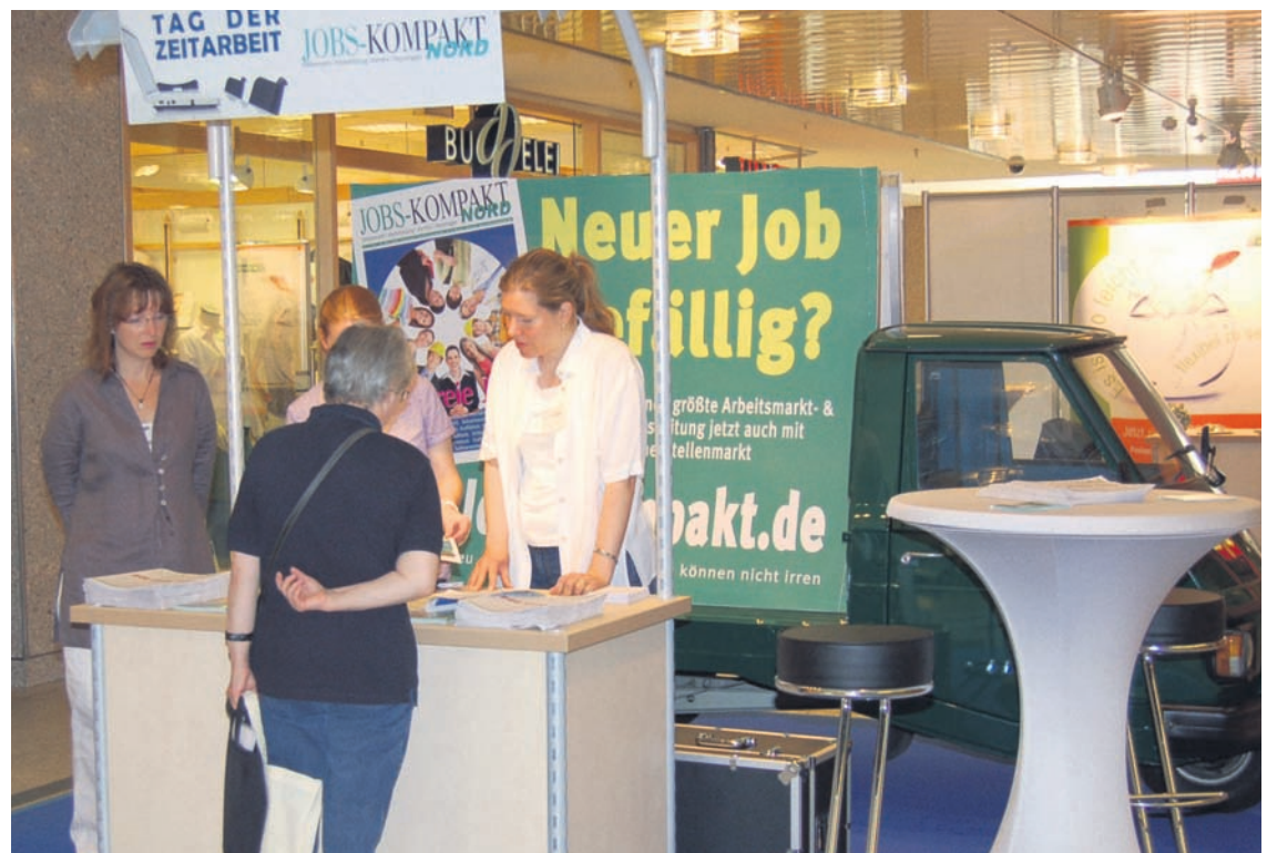
Auch Jobs-Kompakt NORD war auf dem Tag der Zeitarbeit mit einem eigenen Stand vertreten