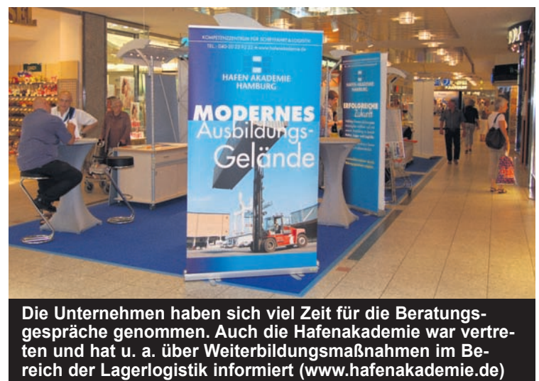
Die Unternehmen haben sich viel Zeit für die Beratungsgespräche genommen. Auch die Hafenum Akademie war vertreten und hat u. a. über Weiterbildungsmaßnahmen im Bereich der Lagerlogistik informiert ( www.hafenumakademie.de )

nur über Zeitarbeit, vornehmen (siehe auch www.Pluss.de )